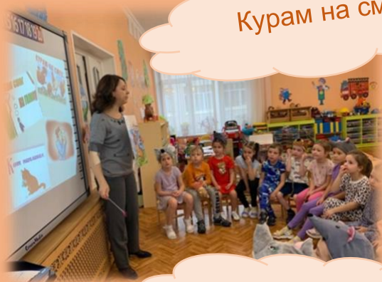
Курам на смех