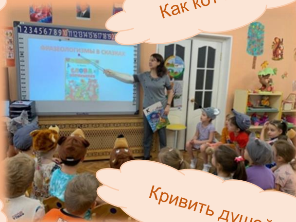
Как кот заплакал