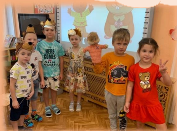
Как снег на голову